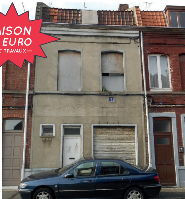
Façade actuelle côté rue