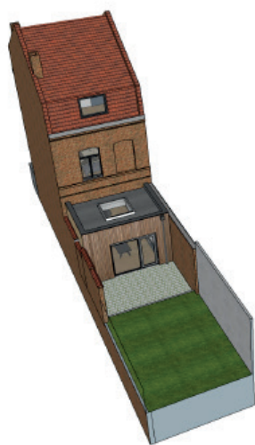
Façade après travaux côté cour