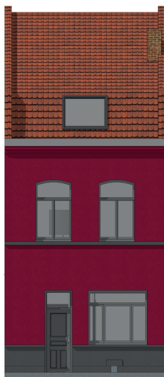
Façade après travaux côté rue

À deux pas de la Condition Publique et tout proche du centre-ville, le Pile se métamorphose. Création de parcs, de jardins, réhabilitations de nombreux logements : l'objectif du projet est de créer un cadre de vie agréable, dynamique et plus accessible.