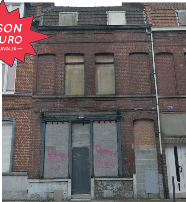
Façade actuelle côté rue