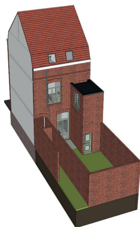
Façade après travaux côté cour