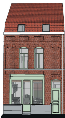
Façade après travaux côté rue

Au nord de la ville, le Cul-de-Four est un quartier résidentiel engagé dans un projet de rénovation. La proximité du canal de Roubaix, de la voie rapide urbaine et de plusieurs écoles sont des atouts pour leurs futurs habitants.